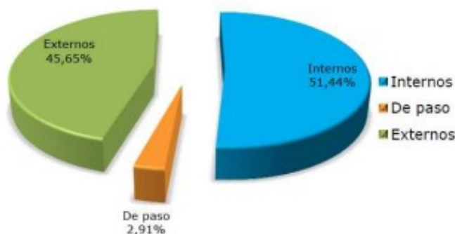
Gráfica 1.- Tipo de Movimiento de Oviedo

Según se desprende del "Estudio para la creación de una matriz Origen/Destino de vehículos en la ciudad de Oviedo" redactado por VECTIO en Diciembre de 2009, del tráfico en vehículo privado en Oviedo, más del 51% son viajes internos, es decir, con origen y destino Oviedo: